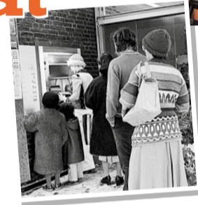
Eén van de eerste betaalautomaten van de Gemeentegiro Amsterdam in gebruik op het kantoor aan het Buikslotermeerplein.